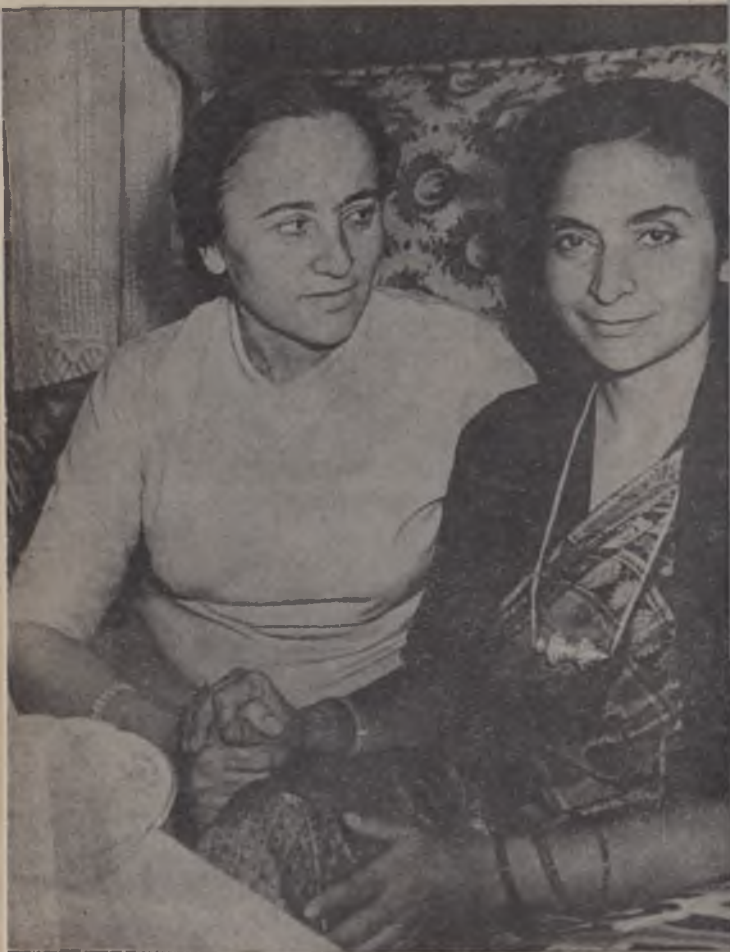
Зулфия ва ҳинд шоираси Амрита Притам мулоқотда. 1961 йил.