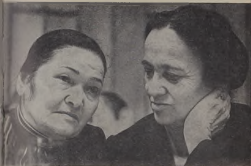
Зулфия ва СССР халқ артисти Сора Эшонтўраева. 1934 йил.