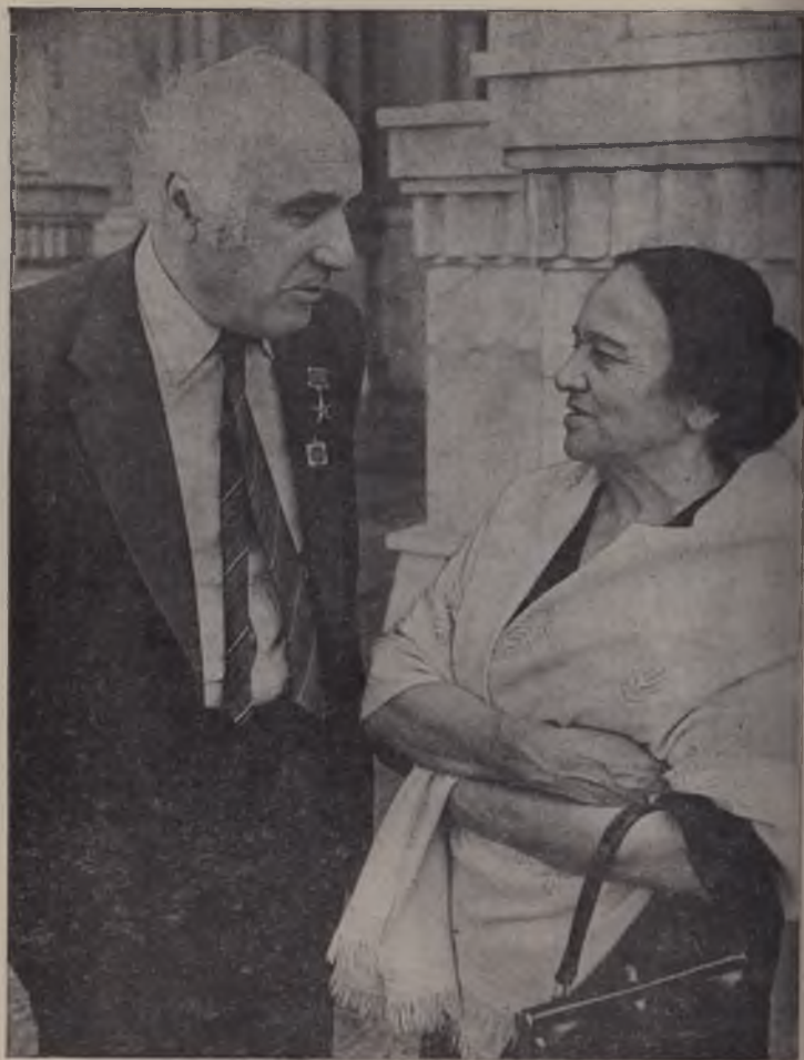
Зулфия машхур грузин шоири Ираклий Абашидзе билан суҳбатда. 1983 йилнинг октябри.