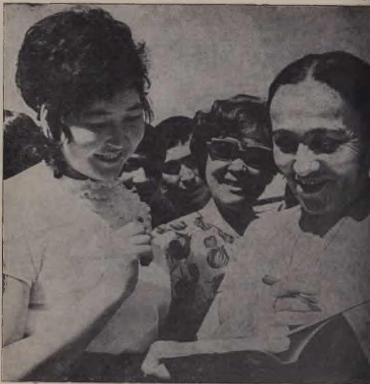
Қозғиствлик шеър мухлислари дастхат олмоқдалар.