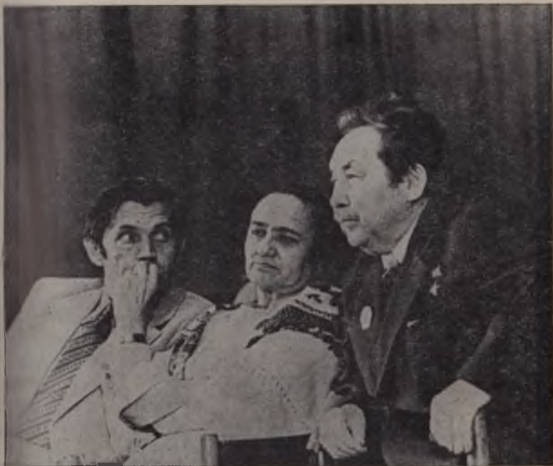
Роберт Рождественский, Зулфия, Аали Туқомбоев.