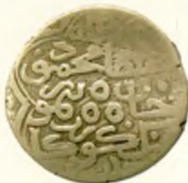
Танга. Амир Темури ва Маҳмуд. Мордин шаҳри. Оғирлиги 5,95. Санаси ўчиб кетган.