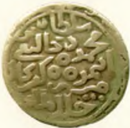
Танга. Амир Темур ва Маҳмуд. Исфаҳон шаҳри. Оғирлиги 6,03 гр. Кумуш. Санаси учиб кетган.