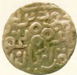
Мири. (Беш тийинлик танга). Амир Темури ва Маҳмуд. Хоразм. Оғирлиги 1,50. Кумуш, 1394.