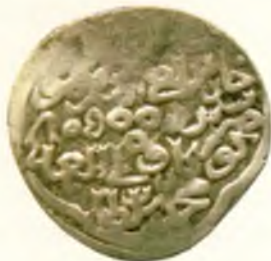
Танга. Амир Темури ва Муҳаммад Султон. Язд шаҳри. Оғирлиги 6,17 гр. Кумуш, 1402.