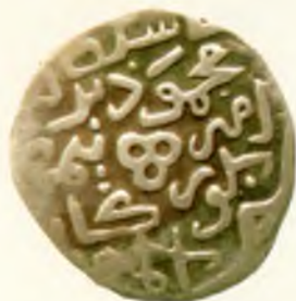
Мири (беш тийинлик танга). Амир Темур ва Маҳмуд. Самарқанд шаҳри. Оғирлиги 1,51 гр. Кумуш. 1395.