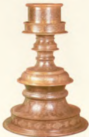
Бронза шамдон. Туркистон. XV аср.