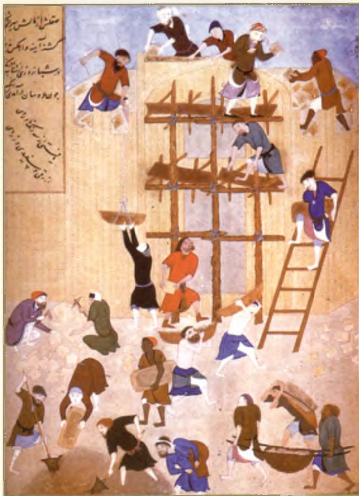
Ховарнак қасри қурилиши. Камолитдин Беҳзод расми. Ҳирот. 1494–1495 йиллар.