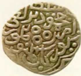
Мири (беш тийинлик танга). Амир Темур ва Маҳмуд. Самарқанд шаҳри. Оғирлиги 1,51 гр. Кумуш. 1391.