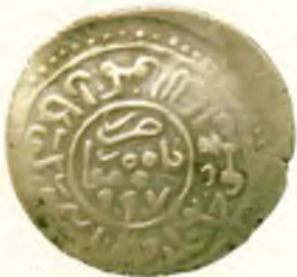
Танга. Амир Темури ва Маҳмуд. Бомийон. Оғирлиги 5,95. Кумуш. 1397–1398.