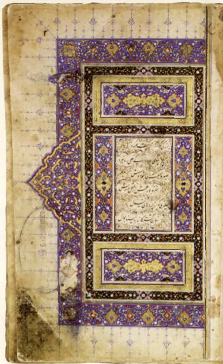
Абдулла Хотифий «Темурнома» асари қўлёзмаси зарварағи. 1568 йилда Али Ризо котиб томонидан кучирилган. Абу Райҳон Беруний номидаги Шарқшунослик институти фондида сақланади. Инв. рақами 2102.