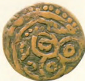
Фулус (танганинг бир тури). Амир Темури. Оғирлиги 2,45 гр. Мис.