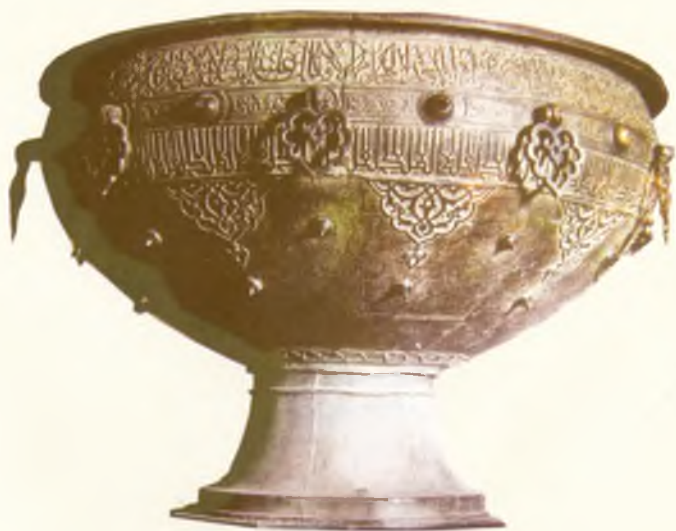
Хожа Аҳмад Яссавий мақбараси учун ясалган қозон. Самарқанд. XIV аср охири.