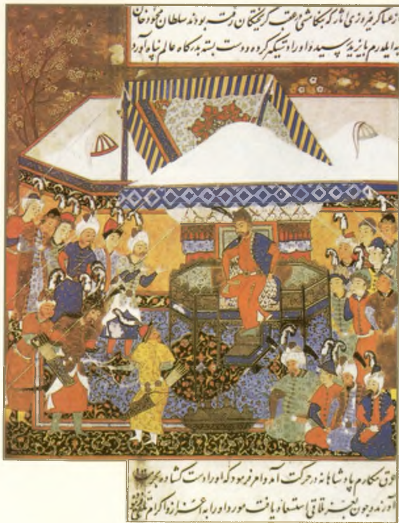
Султон Махмудхон асир олинган Султон Боязид Йилдиримни Амир Темур хузурига келтирмоқда. Шарафуддин Али Яздий «Зафарнома» қўлёзмасидан миниатюра. Шероз. 1553 йил.