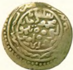
Танга. Амир Темури ва Маҳмуд. Кошон шаҳри. Оғирлиги 6,00 гр. Санаси ўчиб кетган.