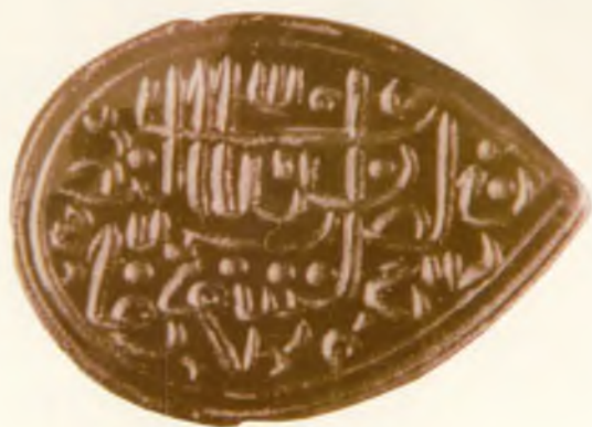
Шохруҳ Мирзо рафиқаси Гавҳаршодбегимнинг муҳри. Хирот. 1457 йилдан аввал.