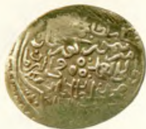
Танга. Амир Темур ва Муҳаммад Султон. Султония шаҳри. Оғирлиги 6,21 гр. Кумуш. Санаси учиб кетган.