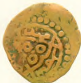
Фулус (танганинг бир тури). Амир Темур. Самарқанд шаҳри. Оғирлиги 3,51 гр. Мис. 1383.