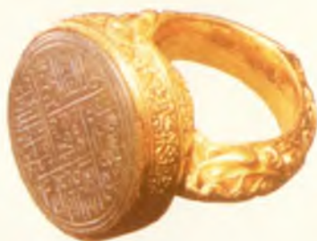
Муҳр. Марказий Осиё. XV аср.