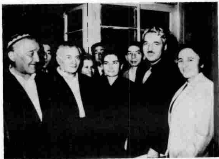
А. Қаҳдор ёзувчи биродарлари давраида. 1958 йил.