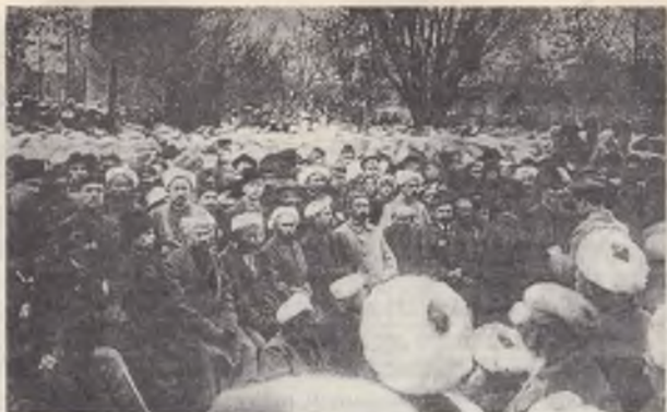
Туркистон мусулмонларининг IV фавқулудда Курултойида сайланган Туркистон Мухтор республикаси Вақтли ҳукуматининг аъзоларидан бир ғуруҳи (олд қаторда)

рият кенг ҳуқуқ ва имтиёзларга эга бўлган вилоят, уезд ва туманларга бўлиниши назарда тутилмоқда эди.