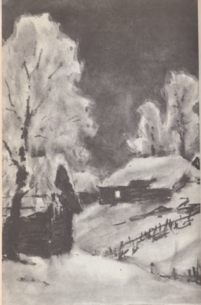
«Очерк зимнего дня»