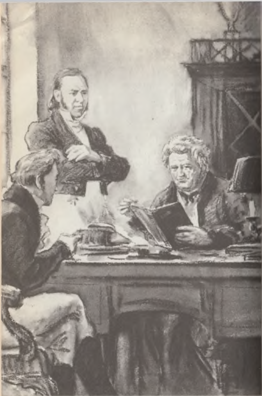
«Воспоминание об Александре Семеновиче Шишкове»