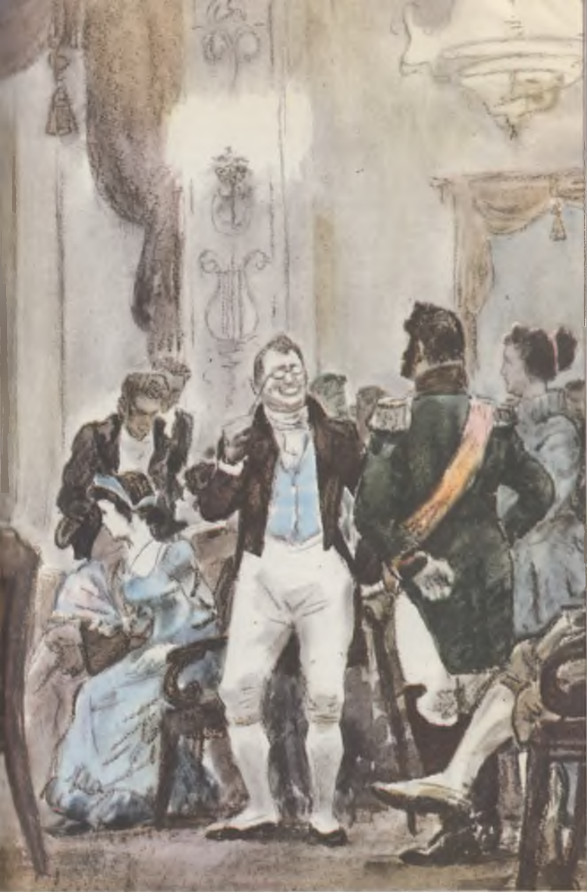
«Воспоминание об Александре Семеновиче Шишкове»